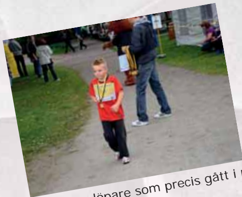
Duktiga löpare som precis gått i mål.