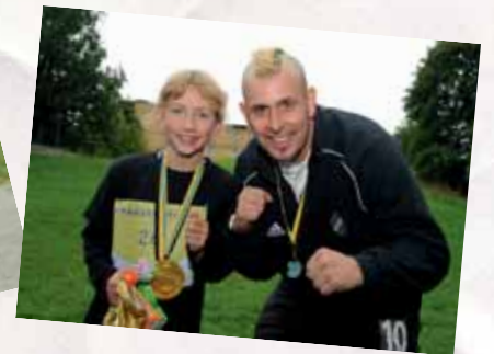
I målområdet fanns Dogge och grattade och hälsade på de duktiga löparna.