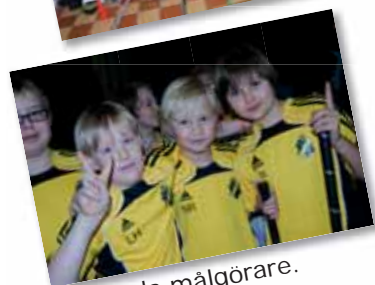
Tre glada målgörare.