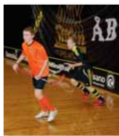
AIK-killar in action!