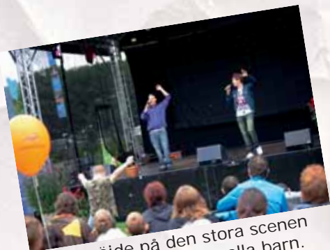
Dogge röjde på den stora scenen efter att ha värmt upp alla barn.