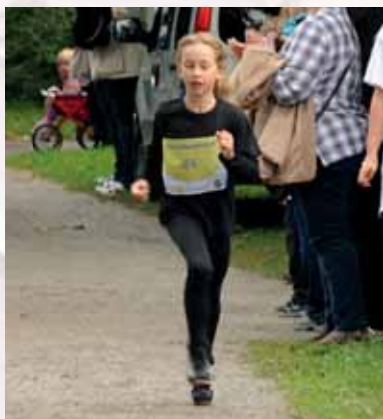
Här gick det undan!