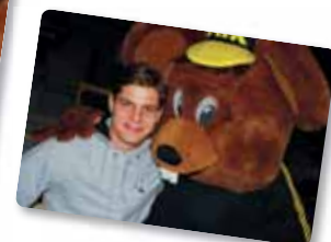
Både små och stora ville hälsa på Gnagis.