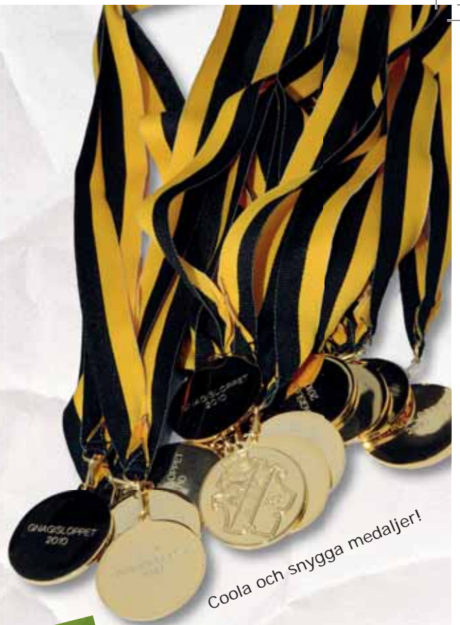
Coola och snygga medaljer!

Näst år är det dags igen för Gnagsloppet! Se till att du får en plats till evenemanget. Mer information om nästa års lopp kommer till våren!