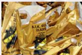
Snygga påsar delades ut vid målgång.