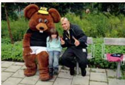
Några passade på att hälsa på Gnagis och Dogge innan loppet.