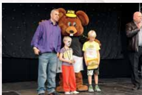
Prisutdelning och intervjuer från den stora scenen.