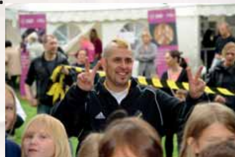
Dogge peppade vid starten.